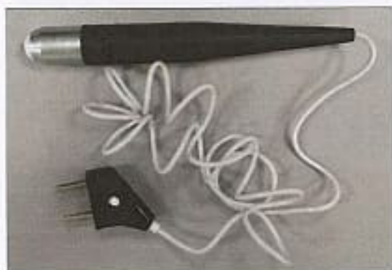
пробник высокочастотный ВЧ