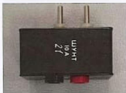
шунт «10 А»