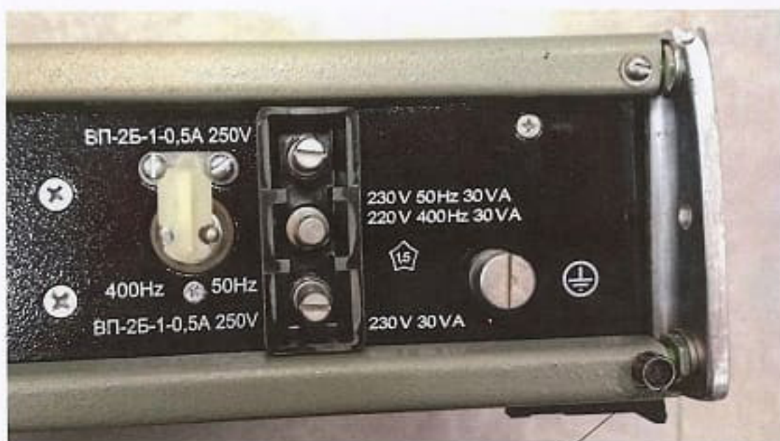
Схема пломбировки от несанкционированного доступа

Место пломбировки от несанкционированного доступа (оттиск клейма ОТК)