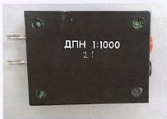
делитель переменного напряжения ДПН