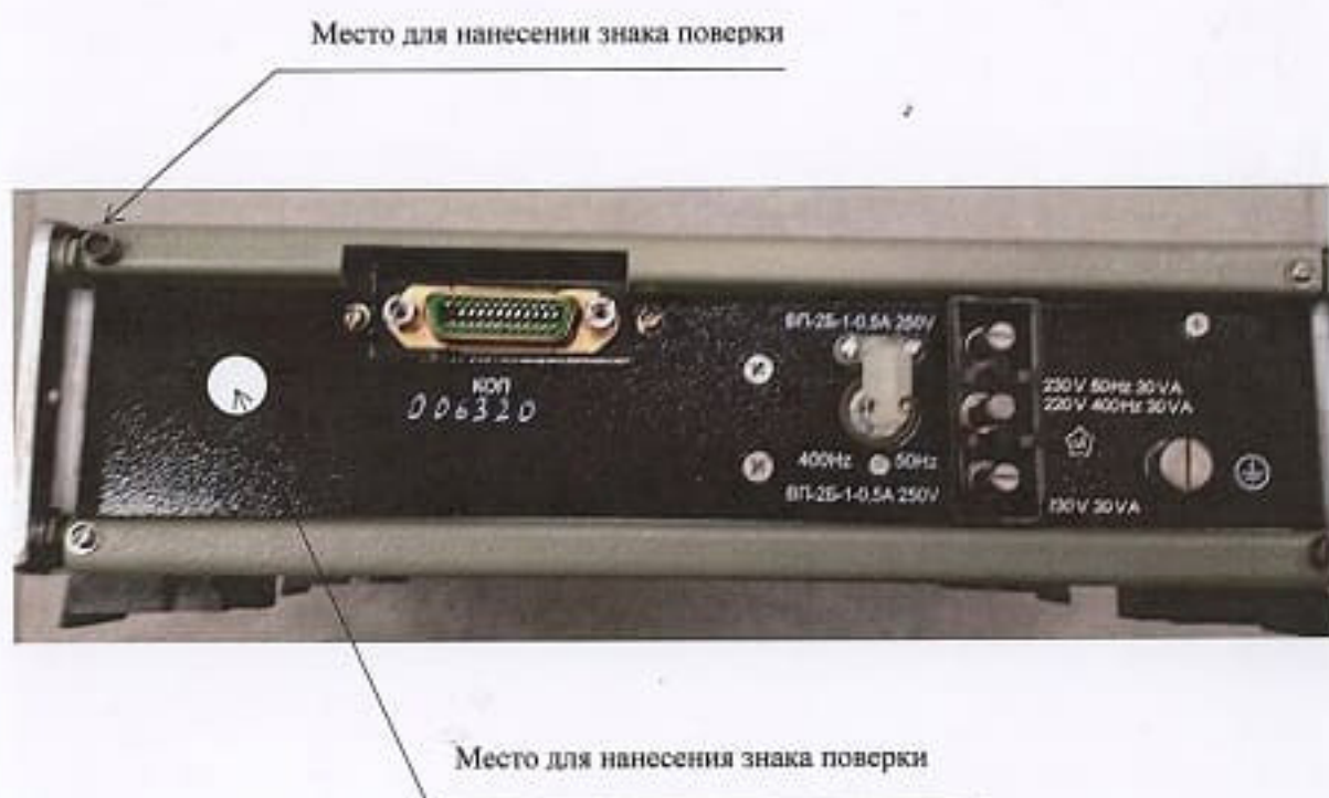
Рисунок 2.1 – Схема (рисунок) с указанием места для нанесения знака поверки

Схема (рисунок) с указанием места для нанесения знака поверки средств измерений