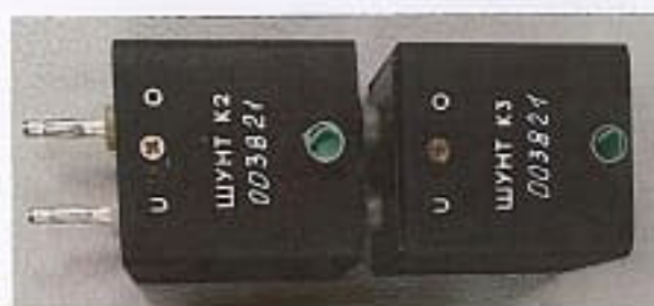
шунты «К2», «К3»